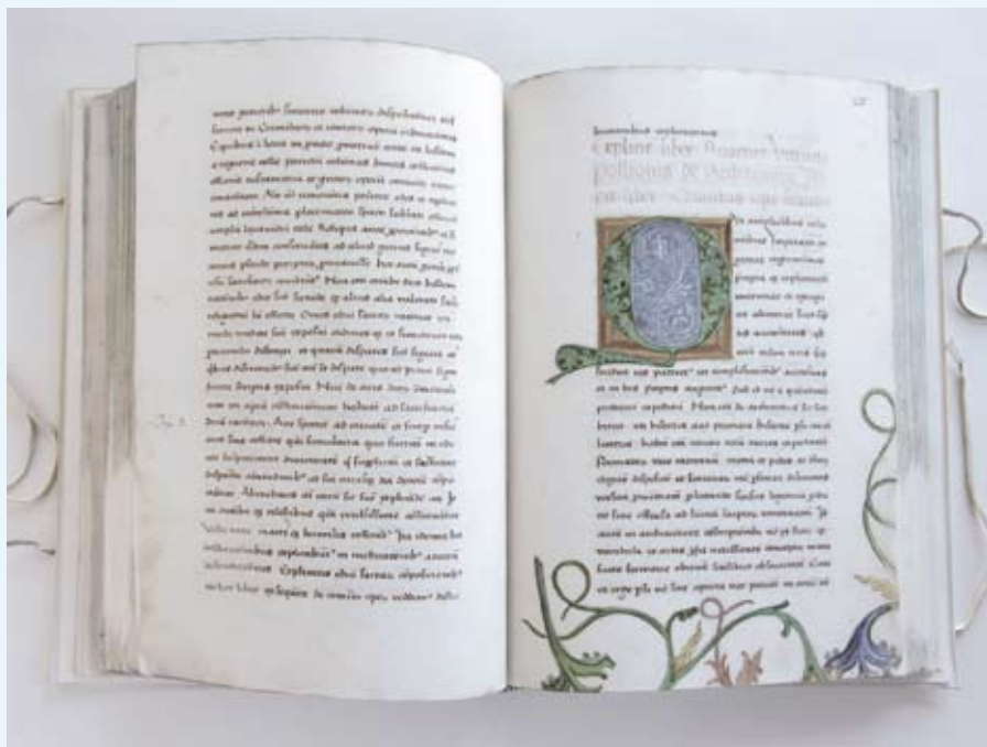
Przykład stanu zachowania rękopisu z przełomu XV i XVI wieku spisane na papierze ręcznie czerpanym i kalendarza z 1900 roku wydrukowanego na kwaśnym papierze maszynowym.

Od połowy XVIII wieku wprowadzane, oparte już na najnowszej technologii, zmiany w produkcji papieru coraz to bardziej obniżały jego jakość i trwałość. W miejsce drewnianych stęp użyto metalowych noży do cięcia włókien, które nazbyt je skracały, zastosowano do wybielania chlor, który zakwaszał masę, wprowadzono słomę, pokrzywy, chmiel, aż w końcu użyto ścier drzewny. Ten ostatni produkt wyparł zastosowanie szmat, stał się materiałem tanim i powszechnym. Ale nie sam ścier drzewny jest przyczyną kruchości kart, lecz również dodawane wtedy do